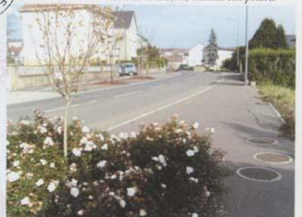
Rue du 12 Septembre 1944, réaménagement voirie