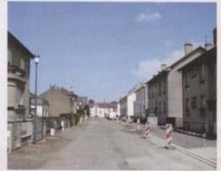
Rue du Moulin avant travaux