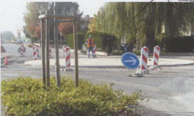
Rond-point, rue du 12 Septembre 1944