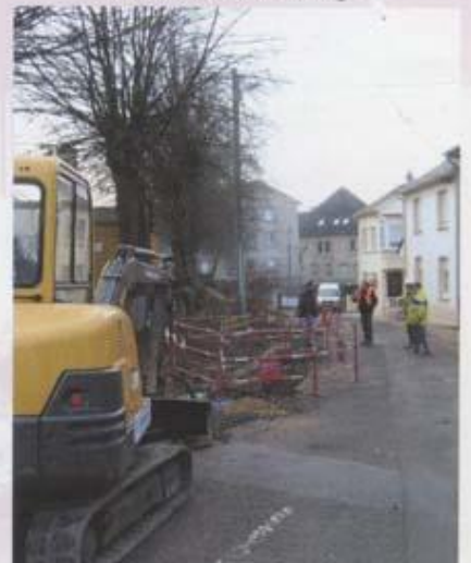
Rue de la Liberté, travaux eau potable