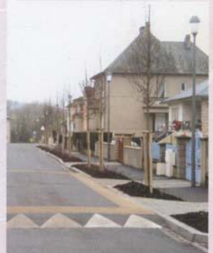
Rue du Moulin réaménagée